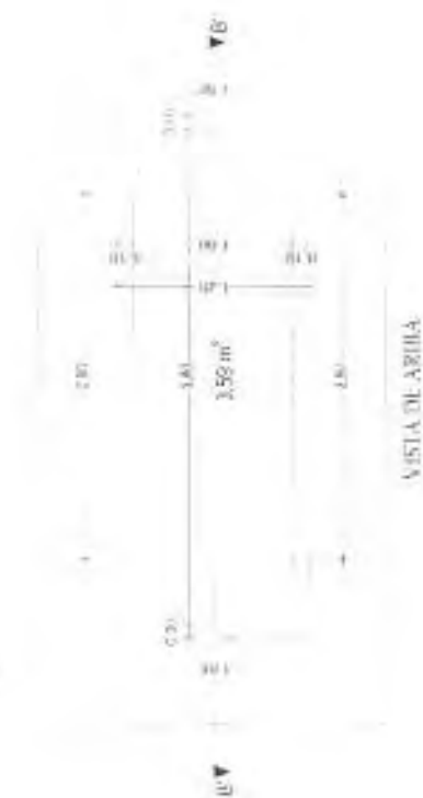
VISTA DE ARRIBA